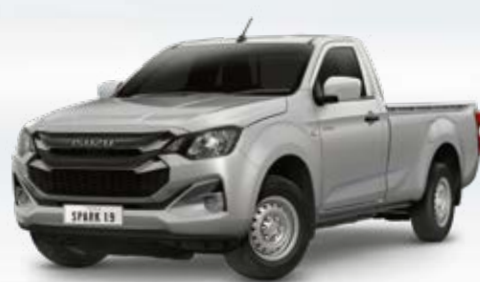
Bohemian Silver Metallic