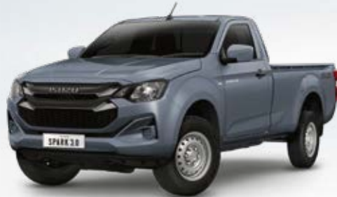
Islay Gray Opaque