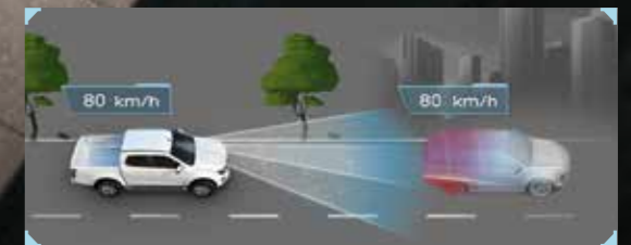
• ระบบควบคุมความเร็วอัตโนมัติแบบแปรผัน ACC (Full Speed Range Adaptive Cruise Control) พร้อมฟังก์ชัน Stop and Go