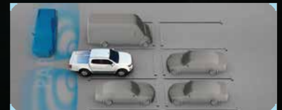
• ใหม่! ระบบแจ้งเตือนขณะถอยรถชน RCTA (Rear Cross Traffic Alert) พร้อมระบบเบรกฉุกเฉินอัตโนมัติขณะถอย RCTB (Rear Cross Traffic Brake)