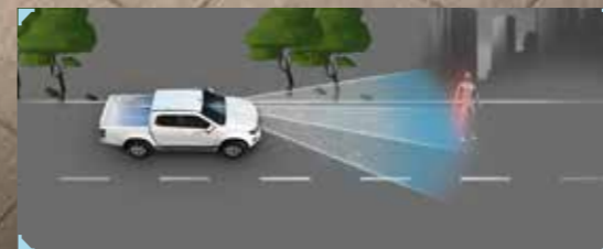
• ระบบแจ้งเตือนก่อนการชนด้านหน้า FCW (Forward Collision Warning) พร้อมระบบเบรกฉุกเฉินอัตโนมัติ AEB (Autonomous Emergency Braking)

ใหม่ล่าสุด! ระบบช่วยเหลือผู้ขับขี่ ADAS ด้วย 3D Imaging Stereo Camera ที่มีมุมมองกว้างและแม่นยำยิ่งขึ้น พร้อมเรดาร์ 2 จุด และเซ็นเซอร์ 8 จุดรอบคัน