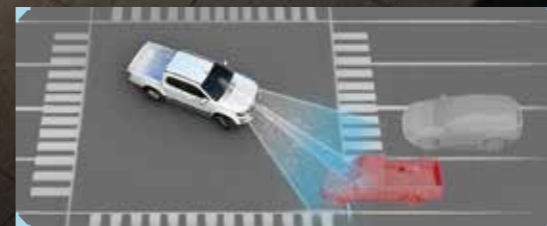
• ระบบเบรกฉุกเฉินอัตโนมัติเมื่อมีรถสวนทางชน-เลี้ยวขวา TA-AEB (Turn Assist with AEB)